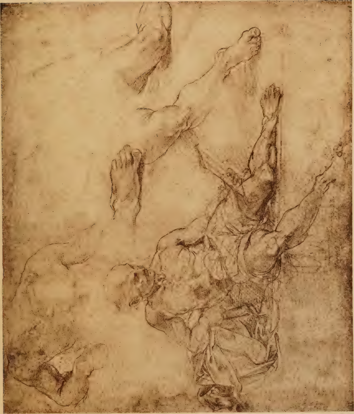
Etude pour la figure du Diogène de l'Ecole d'Athènes, salle de la «Signature» du Vatican